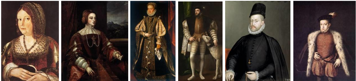
Juan de Borgona, Lady with a Hare, první pol. 16. stol, Christian Museum

Vzhled, který v první polovině 16. století španělská móda nastolila, nejen že ovlivnil celou západní Evropu, ale na územích ovládaných Habsburky se udržel až do následujícího století.